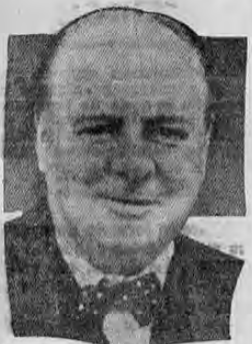
CHURCHILL, apoya el panamericanoismo