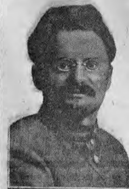
TROTZKI, el líder asesinado

En días pasados glosamos para los lectores de esta sección el discurso del señor Churchill. Un discurso muy inglés que ha debido impresionar vivamente a los ingle