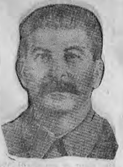
STALIN, la voz de Rusia actual.

les en toda Europa. Y no poeta, por Byron, moría en Misolungi por la libertad de Grecia. Pues bien, siguiendo esta vieja tradición de principios, los ingleses están convencidos de que su sacrificio significa una ofrenda a la democracia mundial y a la libertad. Y en ese sentido sienten, tras sus espaldas en estos días en que están jugándose la suerte de su país y de sus vidas, el apoyo y la simpatía de los pueblos de América y no se desentendían de los problemas de estos pueblos que son sus amigos. Sintieron los ingleses con atención lo que los pueblos americanos dijeron y manifestaron en La Habana; allí se habló de la seguridad continental y fuera de allí, las jefes de estado pública o discretamente, los órganos de la prensa que son reflectores del pensamiento de los pueblos, los más distinguidos ciudadanos, las grandes masas de gentes y elementos representativos americanos han manifestado que consideran que la derrota o el triunfo de Inglaterra son la derrota o el triunfo de las instituciones democráticas mundiales por las cuales los ingleses están peleando. Churchill ha querido sumarse a las determinaciones adoptadas en La Habana; y no simplemente de palabra, lo cual hubiera podido ser a no saber que al fin las palabras no son más que palabras. No simplemente de palabras, decimos, sino con la plena conciencia irrefragable de los hechos. Churchill ha querido que Inglaterra, que puede, colabore a las medidas de seguridad de los